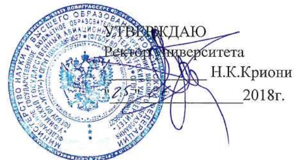
График учебного процесса филиала ФГБОУ ВО "УГАТУ" в г. Ишимбае на 2018-2019 учебный год по программе СПО

15.02.07 "Автоматизация технологических процессов и производств (по отраслям) "